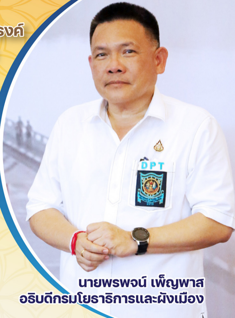
นายพรพจน์ เพ็ญพาส อธิบดีกรมโยธาธิการและผังเมือง

“งดรับของขวัญ ของกำนัล ในช่วงเทศกาล และโอกาสต่างๆ เพื่อเสริมสร้างวัฒนธรรม การทำงานอย่างโปร่งใส”